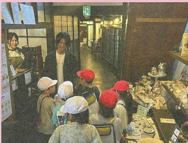
～地元小学生の商店街調査～

地域が直面するさまざまな課題を自らの手で解決して、住み良い地域社会の創造をめざし、 独自の発想により全国各地で活動に取り組んでいる地域活動団体等の皆さまへ — 活動の経験や知恵などのストーリーをレポートとしてぜひお寄せください —